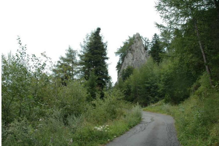
Abb.1 Weise Wand