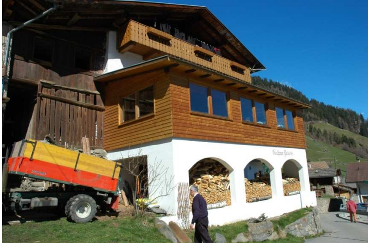
Abb.1 Gasthaus Prünster