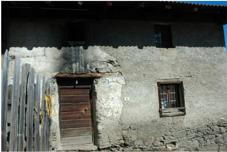
Abb.11 Eingang alte Hofstelle