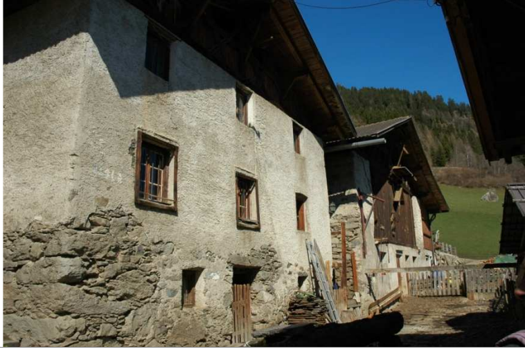
Abb.10 Alte Hofstelle Hofer