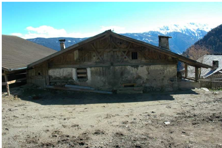
Abb6 Bergseite alte Hofstelle Hofer