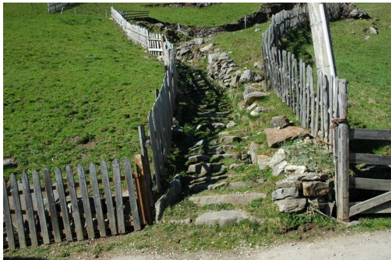
Abb.8 Verbindungsweg Gasse Steinpflasterung