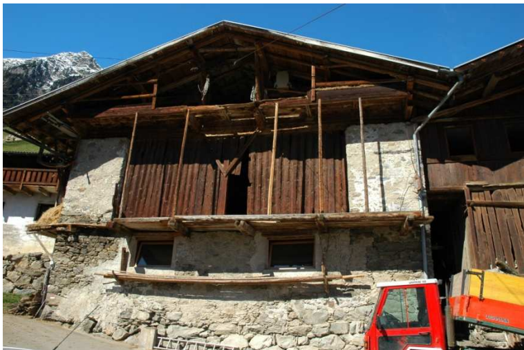
Abb.2 Stadel Prünster